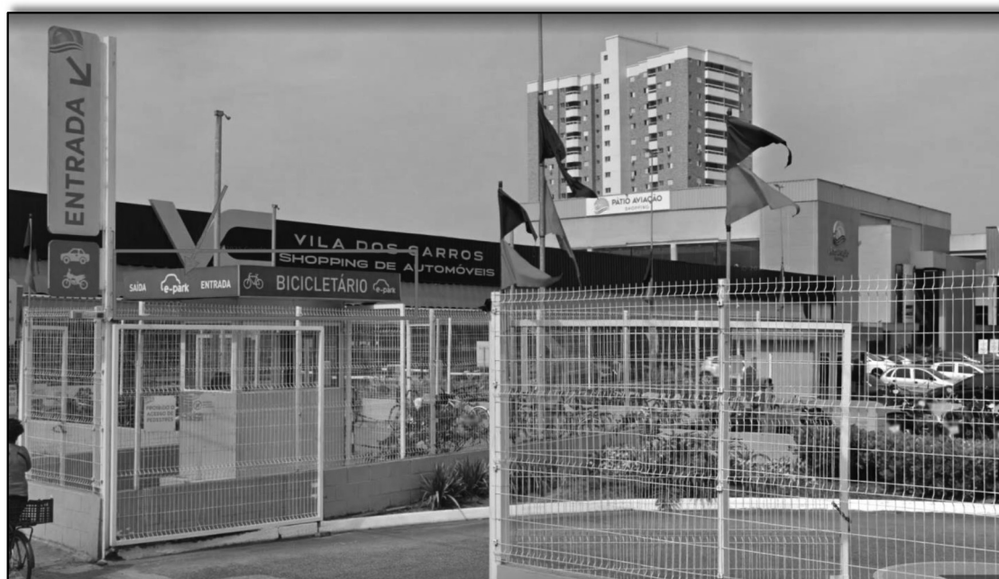
Figura 5 - Imagem do Google Earth que confirma a operação do estacionamento objeto do atestado original apresentado pela empresa “E-park”.