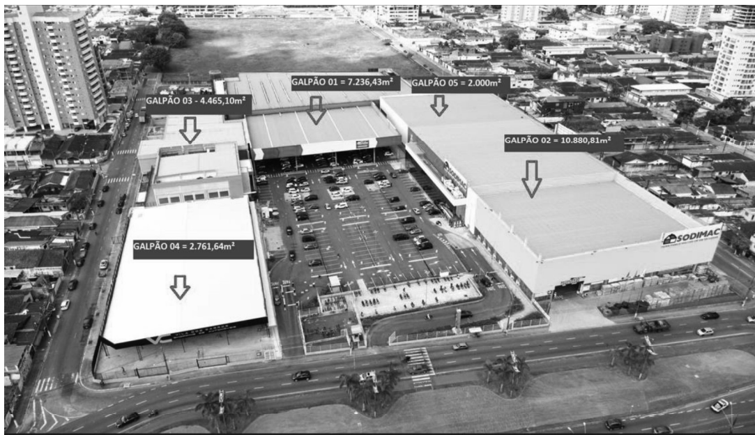
Figura 8 - Doc. 08 – Identificação dos blocos.