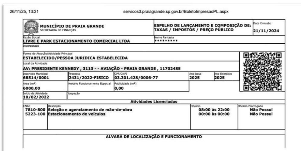
Figura 3 - Alvará de operação em nome da Livre E - PARK demonstrando sua efetiva operação do estacionamento.

Da mesma forma, consta que a LIVRE E PARK ESTACIONAMENTO COMERCIAL LTDA é detentora do alvará de funcionamento relativo ao estacionamento mencionado no atestado, evidenciando que é ela quem possui a autorização formal para explorar economicamente a atividade: