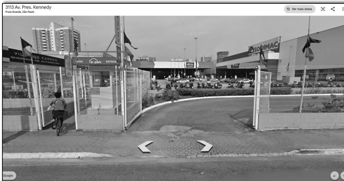
Figura 4 - Imagem do Google Earth que confirma a operação do estacionamento objeto do atestado original apresentado pela empresa “E-park”.