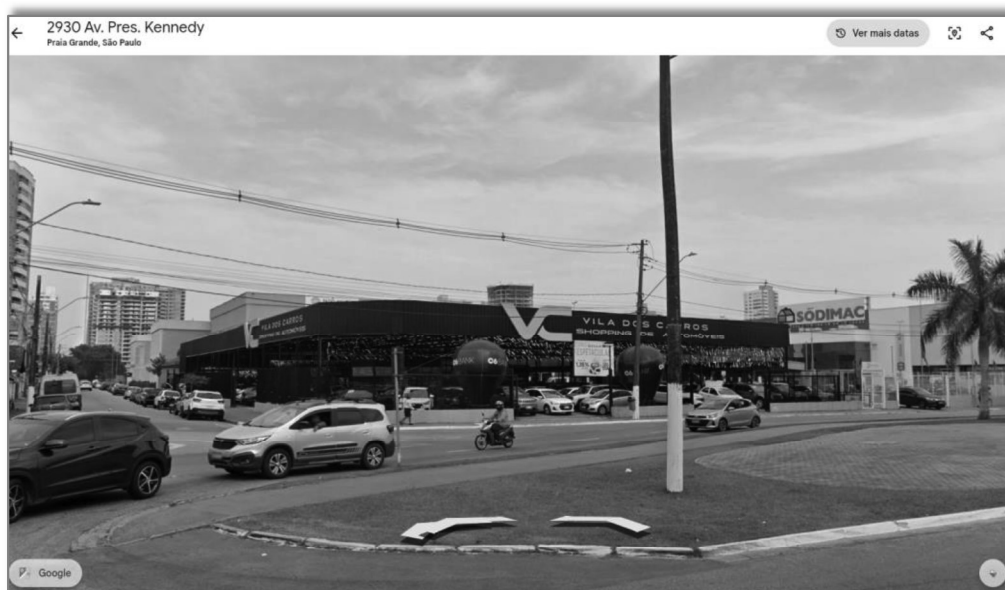
Figura 11 - Imagem frontal do “Galpão 04”.