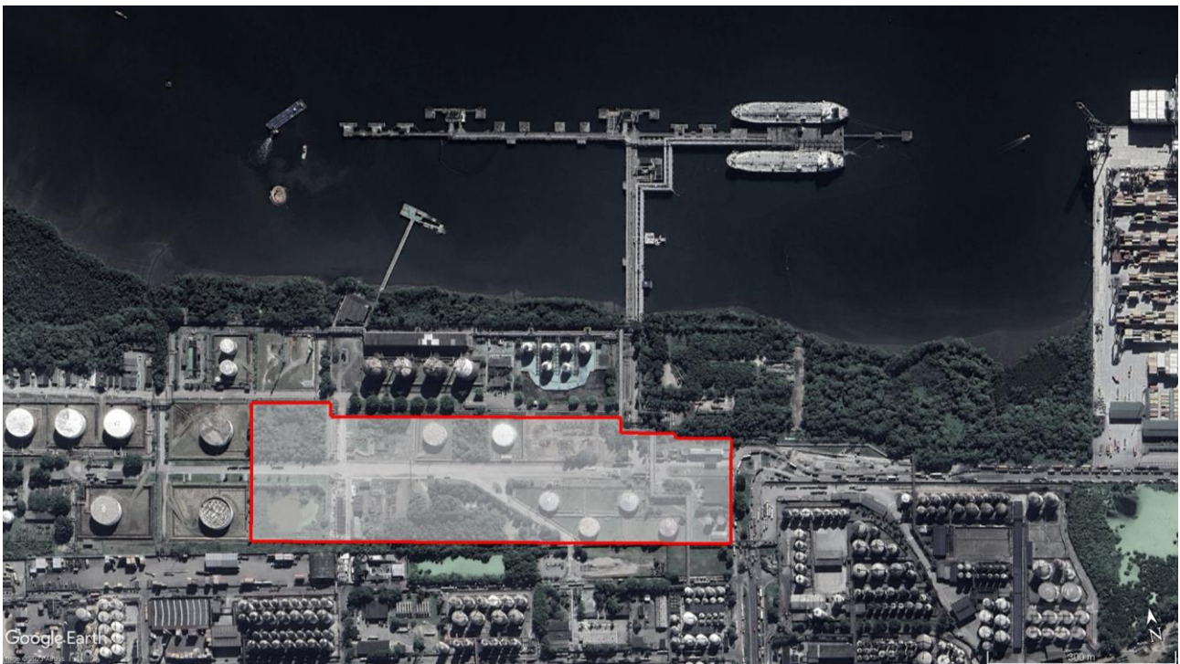
Figura 2 - Anexo C-1: Delimitação STS08 - área definitiva (2025 - 2049).

Dessa forma, visando à implantação das novas estruturas na área atualmente não licenciada, conforme descrito na Etapa de transição constante na Seção C – Engenharia do presente EVTEA, entende-se que a ampliação da operação deverá proceder com o rito de licenciamento ordinário, trifásico, ou seja, englobando a obtenção da licença prévia, de instalação e operação (LP, LI e LO).